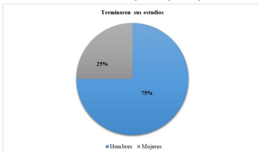
Figura 3.1 Hombres y mujeres que terminaron sus estudios escolares en el nivel superior en porcentajes

Nota: La figura muestra la cantidad de hombres y mujeres chujes que terminaron sus estudios escolares en el nivel superior.